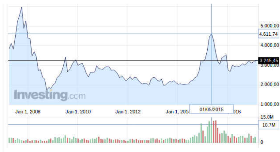
График 2. Китайский биржевой индекс Shanghai Composite в 2008-2017 годах 15

В начале глобального кризиса было признано, что экономики БРИКС являются новыми лидерами и опорой стабильности в мировой торговле. Активизация экономик БРИКС в 2009-2013 годах создала в мире обстановку нового подъема, «посткризисного роста», которая не означала устранения причин мирового кризиса. Напротив, имевшие место в США и ЕС проблемы к 2014-2015 годам проявились и в экономиках БРИКС. Долги трудящихся выросли, что стимулировало рост рынка жилья и строительной отрасли, но в конечном итоге привело к кризисам на национальных рынках, аналогичных ипотечному кризису США. Рост фондового рынка закончился падениями, самым значительным из которых был обвал на Шанхайской бирже в 2015 году (см. График 2.). В ответ на рост проблем потребителей, банков и корпораций, правительства стран БРИКС стали действовать по американской и европейской методике – наращивать долги. Выпуск облигаций облегчал положение в 2016-2017 годах, но гарантировал последствия в духе долгового кризиса в ЕС, ослабления евро и фунта стерлингов (не связанного с падением цен на промышленные и сельскохозяйственные товары), роста безработицы, обострения социальных и политических противоречий. Ко всему этому следует добавить стремление финансовых элит США и ЕС ослабить страны БРИКС политически, лишить их того статуса в международной системе принятия экономических решений, который они получили в 2008 года в рамках G20.